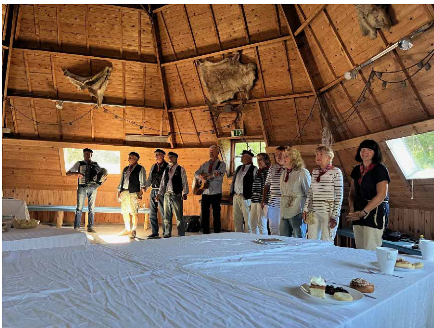
På Lösa Boliner uppträder