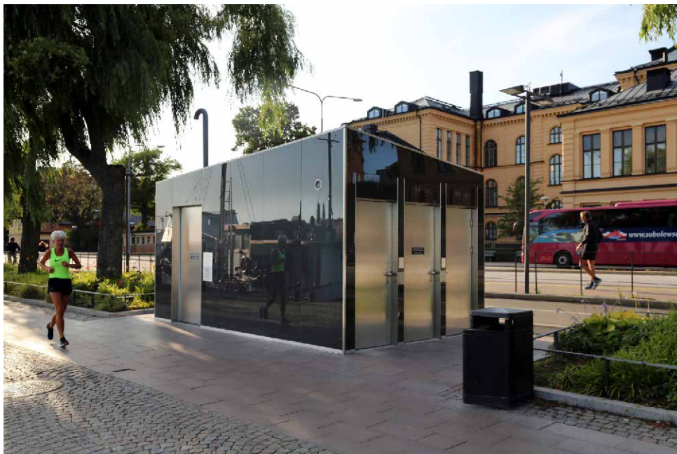
Offentlig toalett i Stockholm.

Undertecknande organisationer måste även ges utrymme att ingå i en referensgrupp till trafikkontorets upphandlare inför framtagande av förfrågningsunderlaget till upphandlingen. Den referensgruppen ska vara med och ta fram ytterligare krav på hur en modern offentlig toalett ska vara utformad för att uppnå full tillgänglighet enligt våra önskemål och modern teknik. Utvecklingen har inte stått still sedan 2014 och det finns utrymme för förbättringar.