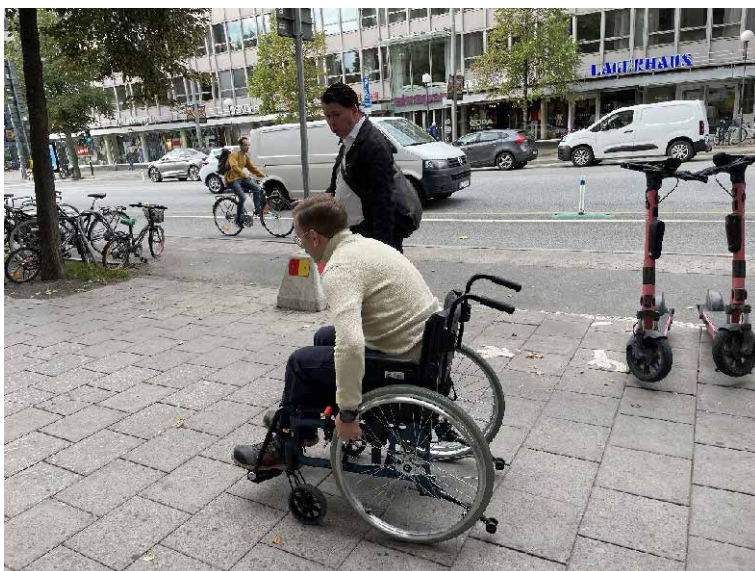
Socialborgarrådet kämpade sig fram på en tidvis ojämn väg.