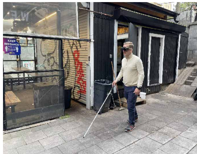
Inte lätt att hitta rätt när man ser lika mycket som "genom ett sugrör".